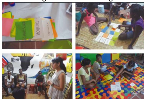
Figura 2. Card sorting

El grupo se subdividió en tres equipos de cinco personas, previamente y a partir de la investigación documental se habían creado dos categorías: una correspondiente a los instrumentos y otra sobre los géneros musicales palenqueros. Los participantes recibían un juego de tarjetas organizándolos y agrupándolos de acuerdo con sus conocimientos sobre los ritmos musicales propios de Palenque, a pesar de que inicialmente se usó un Card Sorting cerrado los grupos podían suprimir, agregar o hacer observaciones sobre los elementos.